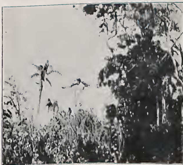
Habitats no Districto de Itaquaquecetuba, Estado de São Paulo